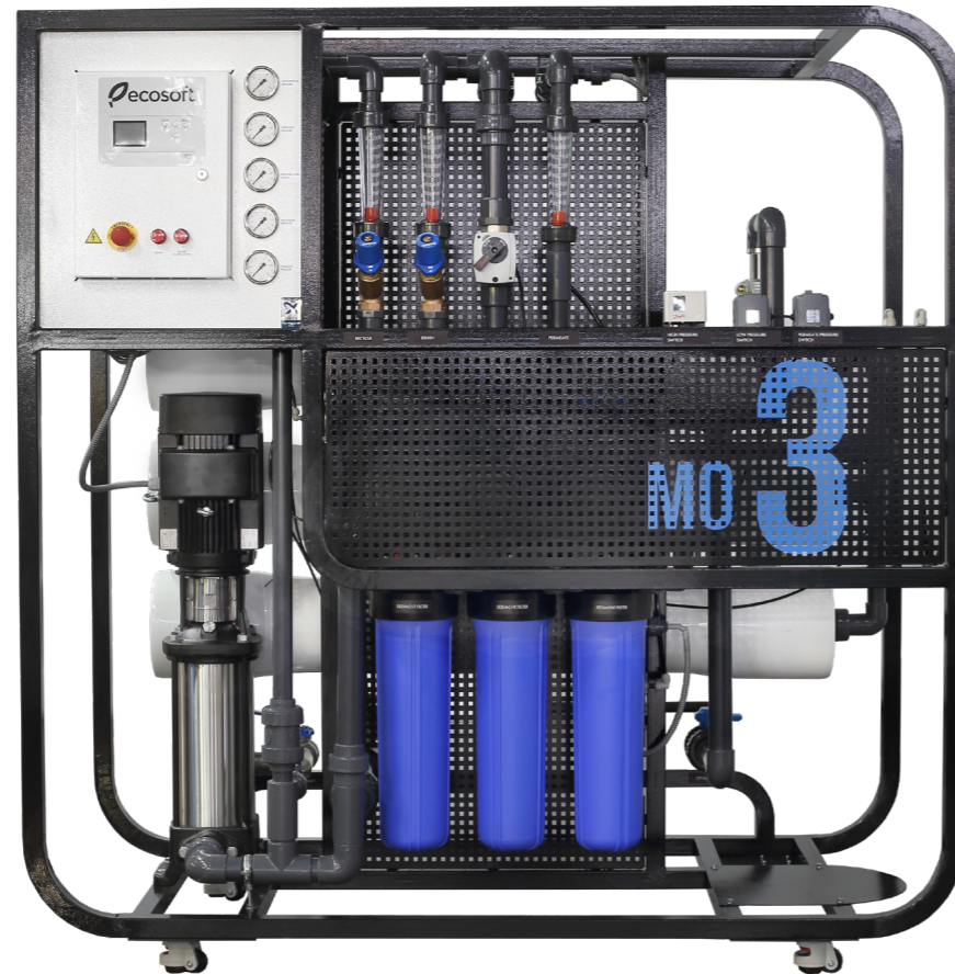
Архитектура установки может быть модифицирована на усмотрение производителя, если это не приведет к существенным изменениям технологической схемы